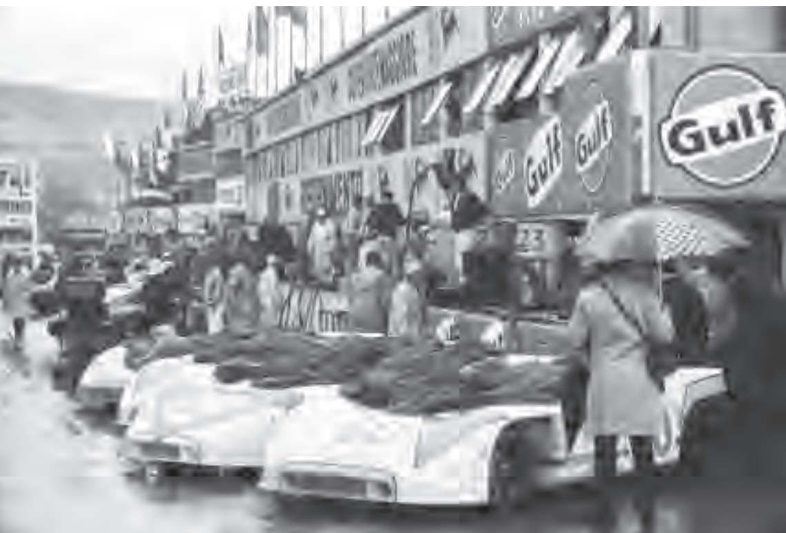
Abgedeckt: In Sizilien regnet es. An den Boxen wartet die Armada der Porsche 908/3. Bei der 54. Targa Florio, die am 3. Mai 1970 auf dem traditionellen Madonie-Strassenkurs ausgetragen wird, kommen die neu entwickelten Dreiliter-Prototypen erstmals zum Einsatz.